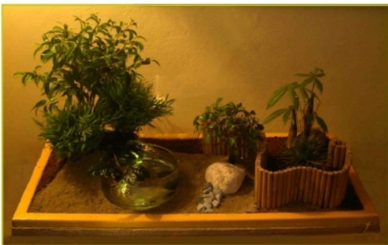
"Controzen" - 50 x 100

" .... Il loro sogno è quello di racchiudere in un unico minigiardino tutte le emozioni e i sentimenti dell'uomo non facendo uso di strumenti tecnici ma solo plasmando la terra, e servendosi degli elementi naturali alberi nani, bonsai, sassi, e tap- peti di erba. Tutto affinché l'uomo si appropri del contatto diretto con la natura, dando la possibili- tà di portare nelle case non solo giardini, ma ar- chitettura e natura insieme.