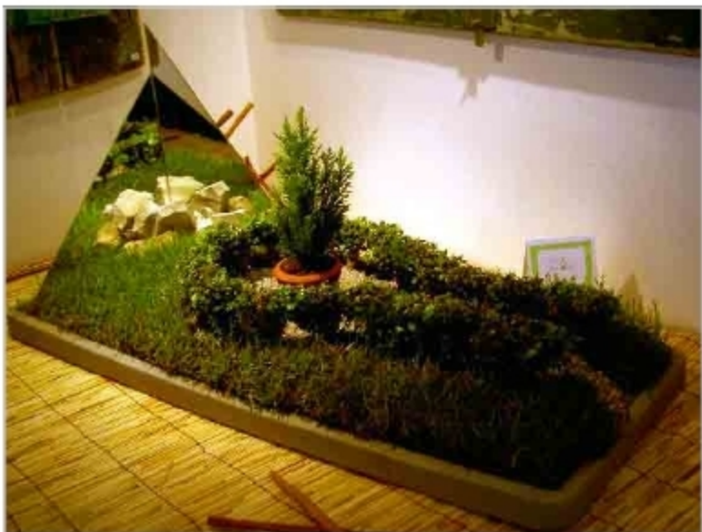
"Firenze città nuova" - 50 x 100